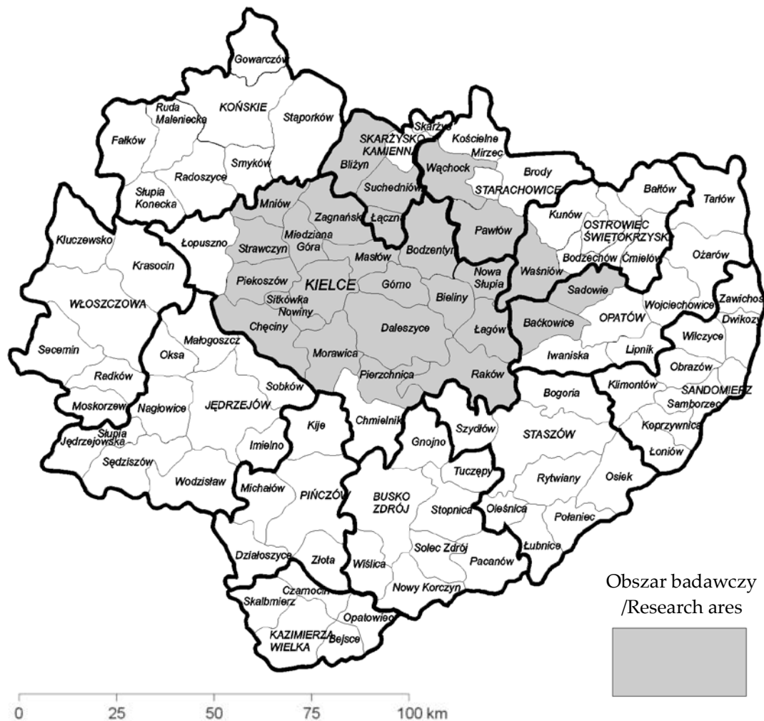
Ryc. 1. Region Gór Świętokrzyskich – podział administracyjny.