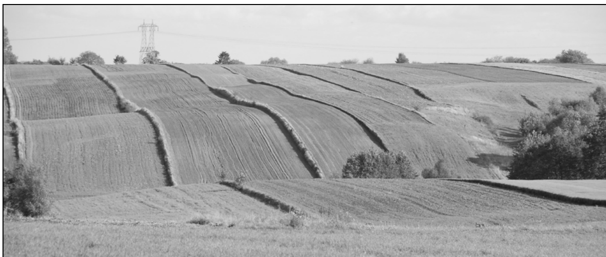
Fot. 1. Układ pól w gminie Bodzentyn.

krajobrazów polnych i leśnych. W Górach Świętokrzyskich pradziejowe krajobrazy archeologiczne ukształtowały się w różnym czasie, były efektem osadnictwa, rolnictwa i górnictwa. Przykładem takiego krajobrazu są okolice Rydna, między Skarżyskiem a Wąchockiem. Przed 8 tysiącami lat na suchym piaszczystym terenie nad rzeką Kamienną działały tysiące osad skupionych wokół kopalni ochry. Środowisko przyrodnicze tego terenu nie zostało zmienione, zagłębienia pogórnice zatarły procesy eoliczne. W okresie borealnym (7 900-6 000 p.n.e.) wydmy terasy nadzalewowej, tak jak przed kilkoma tysiącami lat pokrywają widne zarośla sosnowo-wierzbowe i murawy napiaskowe, występowały także płytkie zbiorniki wodne (Barga-Więcławska, 2012).